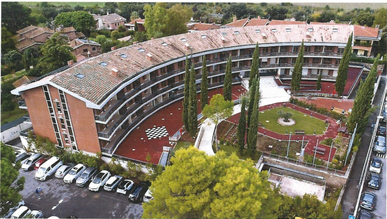
Visione aerea di Villa Tagliaferri